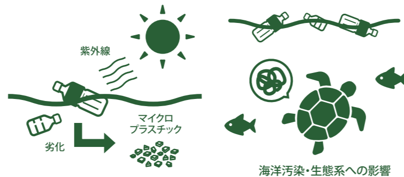
海洋汚染・生態系への影響

海に流入したプラスチックは紫外線によって劣化し、マイクロプラスチックと呼ばれる5mm以下の粒子となり、海洋環境において極めて大きな問題を引き起こす原因となっています。